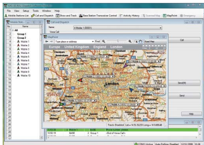
Pantalla AVL (MapPoint®)