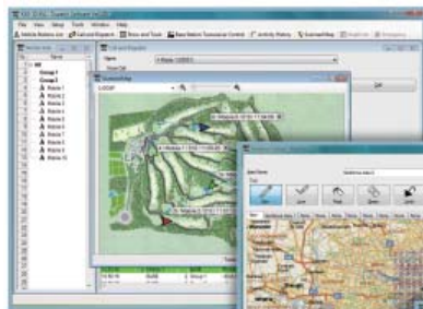
Pantalla AVL (Mapa Escaneado)